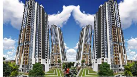
ANKARA ELİT RESIDENCE