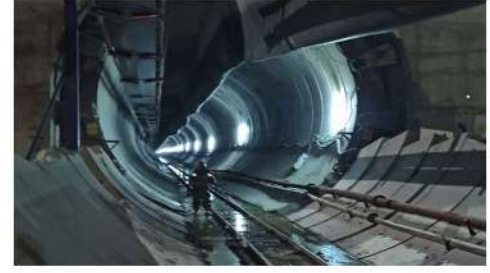
DİYARBAKIR KULP TÜNELİ