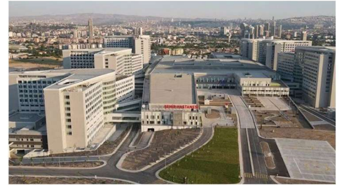
ANKARA ŞEHİR HASTANESİ