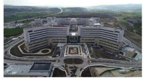
BURSA ŞEHİR HASTANESİ