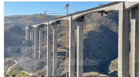
EYİŞTE HADİM VİYADÜĞÜ