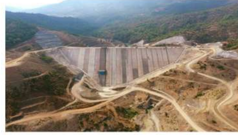
ALANYA GÖKÇELER BARAJI