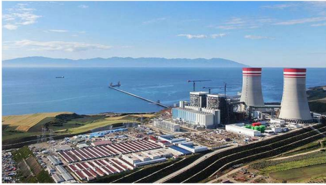
EMBA HUNUTLU TERMİK SANTRALİ