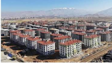
DEPREM BÖLGESİ TOKİ KONUTLARI