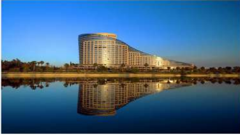
ADANA SHERATON OTEL