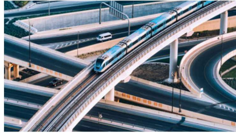
DUBAİ METRO PROJESİ