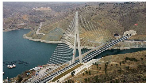
MALATYA KÖMÜRHAN KÖPRÜSÜ