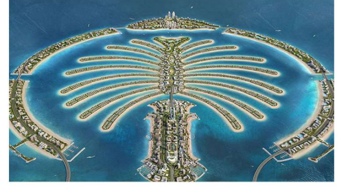
PALMİYE ADASI PROJESİ