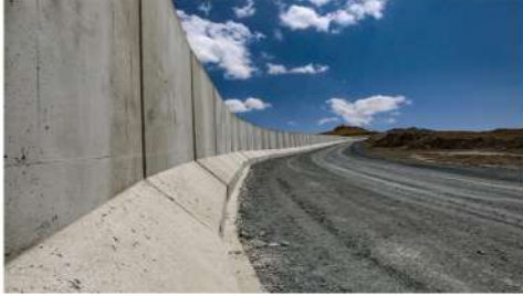
VAN SINIR GÜVENLİK DUVARI