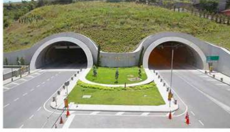
GAZİANTEP ŞAHİNBEY TÜNELİ