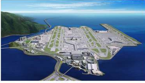
HONG KONG HAVALİMANI