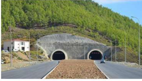
MERSİN AYDINCIK TÜNELİ