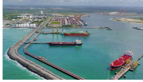
SUAPE LİMANININ UZATILMASI