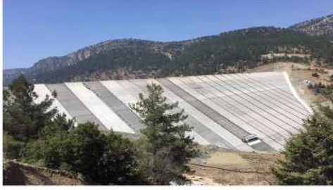
MERSİN SORGUN BARAJI