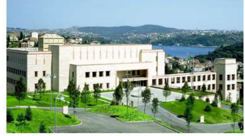
İSTANBUL ABD KONSOLOSLUĞU