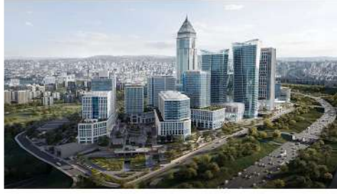
İSTANBUL FİNANS MERKEZİ