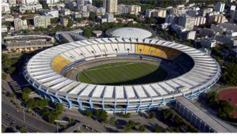
BREZİLYA MARACANA STADYUMU