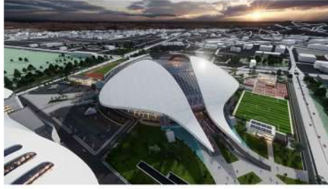
YENİ ANKARA 19 MAYIS STADYUMU