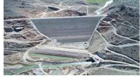
DİYARBAKIR KALE BARAJI